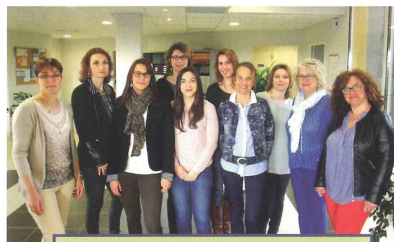
L'équipe administrative du SIAS Escalieu !

Le SIAS Escalieu intervient sur les communes de : Beaumont-sur-Lèze, Eaunes, Frouzins, Labarthe-sur-Lèze, Labastidette, Lagardelle-sur-Lèze, Lamasquère, Lavernose Lacasse, Le Fauga, Lherm, Pins-Justaret, Pinsaguel, Roques-sur-Garonne, Roquettes, Saint Clar de Rivière, Saint Hilaire, Saubens, Seysses, Venerque, Villate, Villeneuve Tolosane.