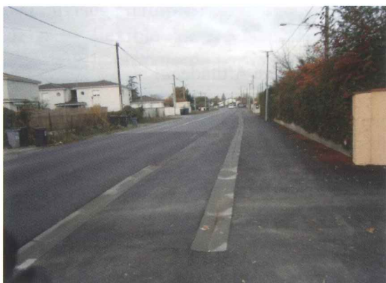
Aménagement en cours