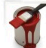
Les déchets toxiques (peintures, phytosanitaires, produits chimiques)

POUR CES DÉCHETS, VOUS POUVEZ UTILISER LES DÉCHÈTERIES DE L'AGGLOMÉRATION.