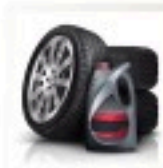
Les déchets issus de l'automobile (pneus, huile, éléments de carrosserie)