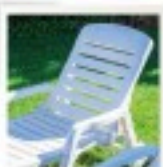
Bains de soleil