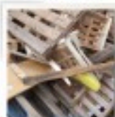
Planche de bois, palettes,