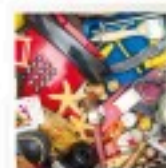
Tas de petits déchets entrant dans le coffre d'une voiture