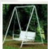
Les éléments de plus de 2m