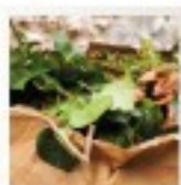
Les déchets verts