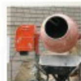
Les éléments de plus de 50 Kg